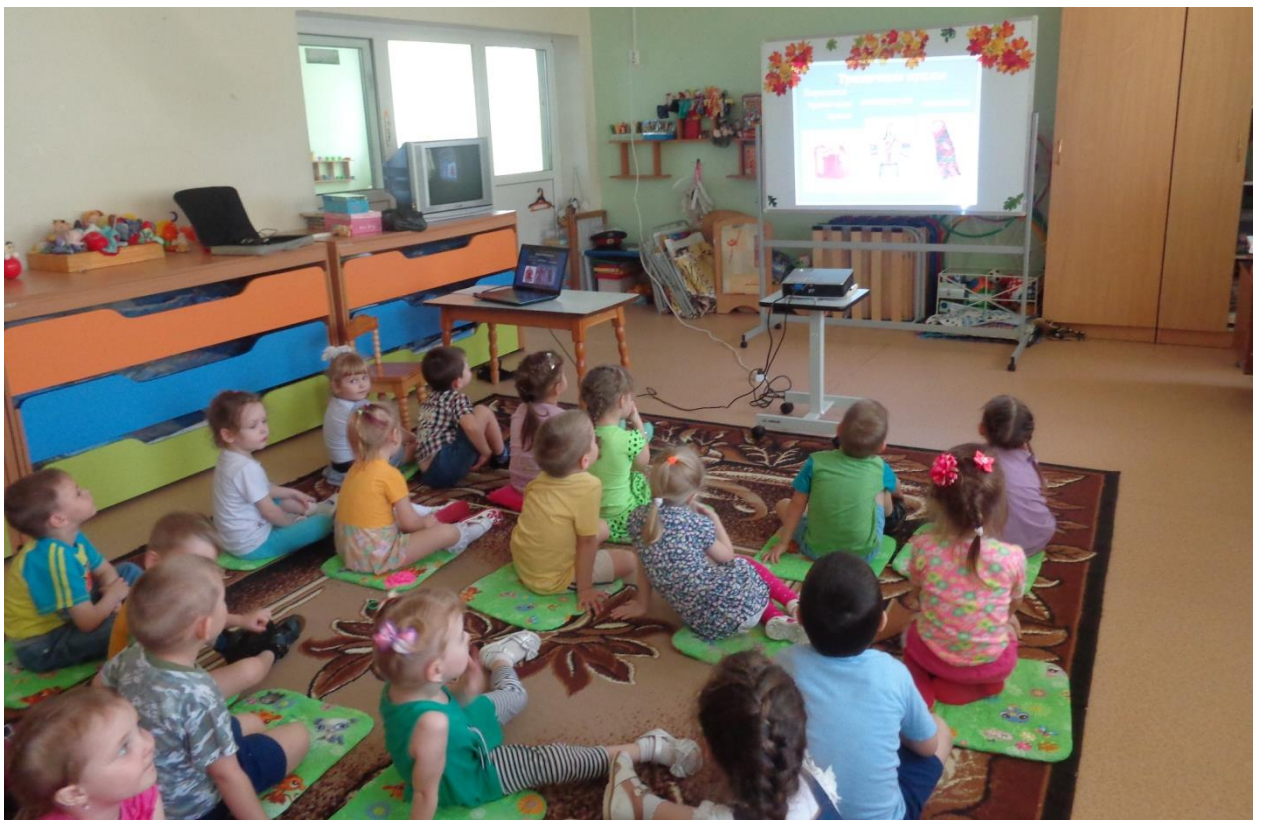
Просмотр презентации «Народная игрушка».

В нашем детском саду проходила тематическая неделя, посвященная народной игрушке. С детьми проводились различные мероприятия по расширению знаний на данную тему.