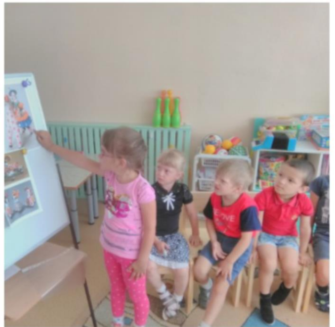
Поиграли в пальчиковую игру «Мы старались рисовать». Прослушали музыкальное произведение «Дымковский пляс».